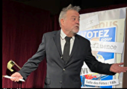
Cie La Mascara