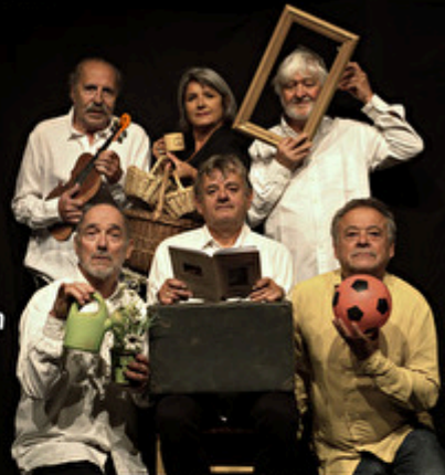
Godemorningue & Cie La Mascara