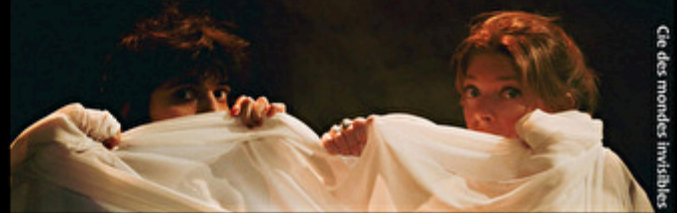
Cie des mondes invisibles

Théâtre de La Mascara 3 impasse de Kerouartz 02310 Nogent-l'Artaud 03 23 70 07 68 mascara@la-mascara.fr