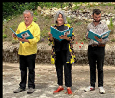
Cie La Mascara

3 histoires pour Camille Lecture-spectacle