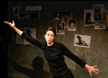
Cie Le hasard n'a rien à se reprocher

Qu'elle se fasse oublier, c'est tout ce qui peut arriver de mieux