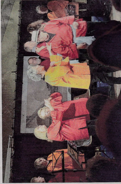
La pièce a été présentée par Le petit théâtre de Montgobert au foyer rural.

► Prochaines représentations le 14 novembre à 20 h 30, salle des fêtes de Louâtre, 28 novembre à 20 h 30, salle des fêtes de Saint-Pierre Aligle. Réservation obligatoire au 06 85 79 28 53 ou sur lepetittheatredemontgobert@gmail.com